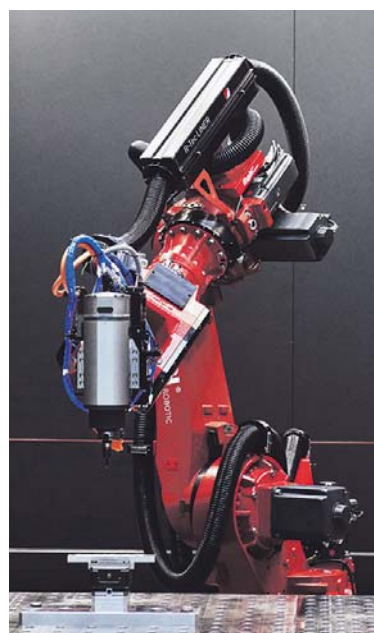
Die Abtragseinheit basiert auf einer standardisierten Frässpindel. Die HSK-E 63-Aufnahme bedient sich aus einem modular erweiterbaren Werkzeugmagazin.